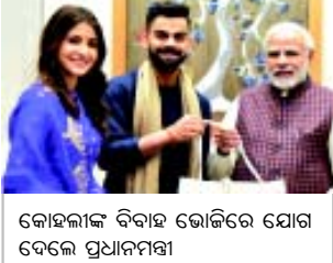
କୋହଳାଙ୍କ ବିବାହ ଭୋଜିରେ ଯୋଗ ଦେଲେ ପ୍ରଧାନମନ୍ତ୍ରୀ