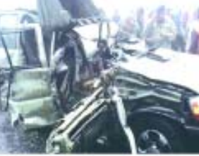
ଦୁର୍ଘଟଣାରେ ୨ ପୋଲିସ ସମେତ ୬ ମୃତ