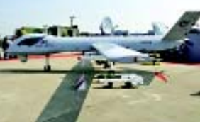
ଚୀନ ପାକିସ୍ତାନକୁ ବେଲା ସୁଖ ଛୋଳ