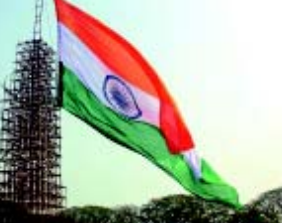
ନଦିଆରେ ଉଡିଲା ସବୁଠାରୁ ବଡ଼ ଡ୍ରାଇଭା