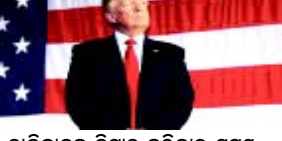
ଡାଲିବାନକୁ ନିପାତ କରିବାର ସମୟ ଉପନୀତ : ଗୁମ୍ଫା