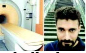
ଅଭିଜେତ ବିଲିଷ୍ଟର ଶାନ୍ତିନେଳା ଏମଆରଆର ମେସିନ : ସୁବଳ ମୃତ